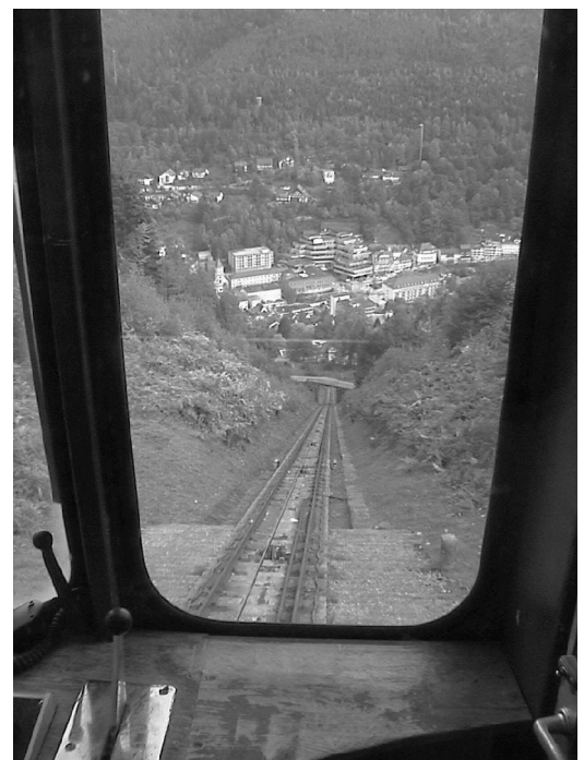
Blick aus der Sommerbergbahn auf Bad Wildbad

Anreise (Fahrplanauszug sonn- und feiertags):