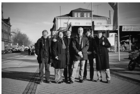
„Expertenteam“ auf Zwischenstation in Offenburg.

Dass gemeinsame Aktionen der Verbände auch Spaß machen sollen, zeigte wieder einmal eine Exkursion nach Straßburg, diesmal u.a. mit „Besichtigung“ der neuen Stadtbahnlinie nach Achern.