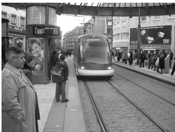
Straßenbahn im Zentrum Straßburgs.

schützer waren mit mehreren Punkten des Projekts nicht einverstanden und als sie mit ihrem Protest nicht erhört worden waren zogen sie vor Gericht. In zwei einstweiligen Verfügungen bekamen sie in einigen Punkten Recht und in einem ordentlichen Verfahren im vergangenen Oktober wurden ihre Be-