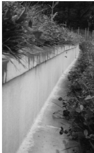
Dauerhafte Leiteinrichtungen ...

Um die Amphibienbestände zu retten, wurden die Tiere von ehrenamtlichen Helfern jahrelang nachts an provisorisch entlang der Straße aufgestellten mobilen (Hasen-)Drahtzäunen aufgesammelt und über die Straße getragen. Eine mühsame und für die Helfer nicht ungefährliche Arbeit!