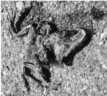
Ohne Leiteinrichtungen entlang der Straße, die mit Tunneln ausgestattet sind, kommen die Tiere durch die Autos um.

Mittlerweile ist der überwiegende Teil des Wanderkorridors mit speziellen, dauerhaften Amphibienleiteinrichtungen (siehe Bild) und -tunneln ausgestattet, die es den Tieren ermöglicht, ohne menschliche Hilfe die B3 zu unterqueren. So gelangen sie alleine sicher zu ihrem Laichgewässer und zurück. Die Schutzanlage an der B3 gilt als eine der am besten funktionierenden Einrichtungen überhaupt.