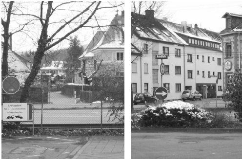
Bild 3/4: Geteiltes Rüppurr, z.B. in Höhe Hedwigstr. und Löwenstr.

Die Grünen haben kürzlich beantragt, per Versuch die Umbaubarkeit der Herrenalber Straße zu prüfen. Der Widerstand der Autolobby kam prompt. Die Straße sei mit ihren 4 Spuren eine wichtige Stadtzufahrt. Dabei nützt ein Umbau dieser Straße nicht nur Fußgängern, Rad- und Bahnfahrern, sondern sogar den Autofahrern selbst! Aber beleuchten wir die Situation genauer: