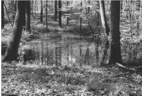
Im Frühjahr wandern tausende von Braunfröschen, Erdkröten und Molchen zum Abbläuen ins Weingartener Moor, ...

Eine der bedeutendsten Amphibienwanderstrecken im Raum Karlsruhe liegt zwischen Grötzingen und Weingarten. Die Tiere wechseln hier zwischen den einzelnen (Teil-) Lebensräumen (insb. das Weingartener Moor mit seinem insgesamt ca. 15 ha großen Laichgewässer, Grötzingener Baggersee im Westen und Bergwald im Osten).