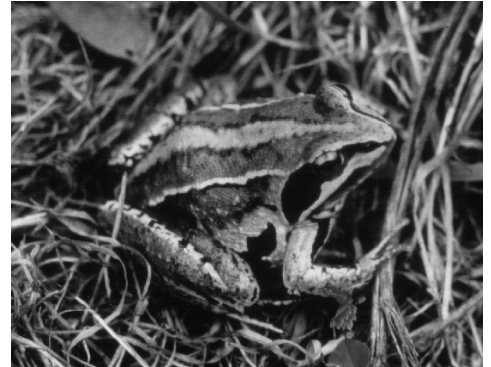
... u.a. der seltene Moorfrosch.

Leider fehlt allerdings noch ein sehr wichtiger baulicher Abschnitt an der Zufahrt zum Grötzingener Baggersee, wo jährlich Tausende von Jungamphibien auf die B3 laufen und dort qualvoll sterben. Mittels eines speziellen Gitterrostes, welches in die Zufahrt eingebaut und in die Leiteinrichtung integriert würde, könnte das Problem gelöst werden. Aufgrund der erheblichen Kürzung der Landesmittel reichen diese aber nicht für die Baumaßnahme aus. Daher: