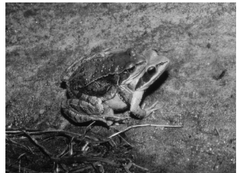
... leiten die Tiere zum nächsten Tunnel, so dass die B3 sicher unterquert werden kann.