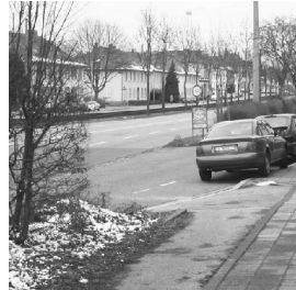
Bild 6: Gefährliches Einfädeln nördlich der Battstr.